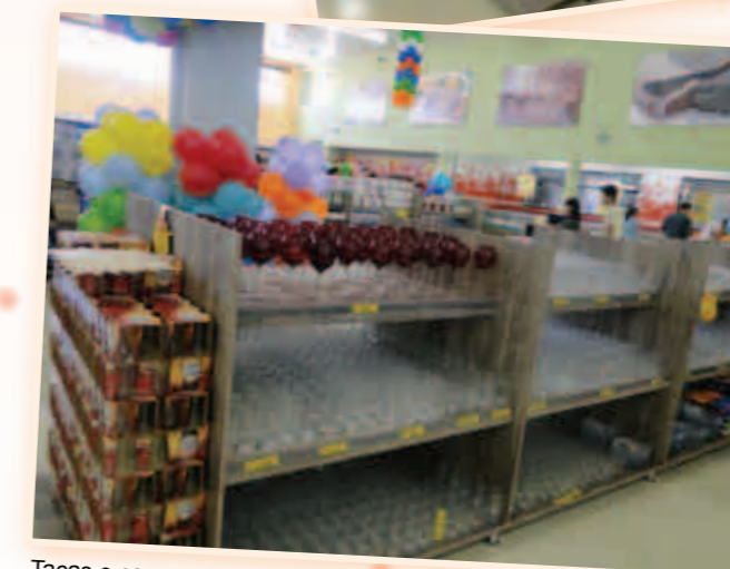
Taças e copos