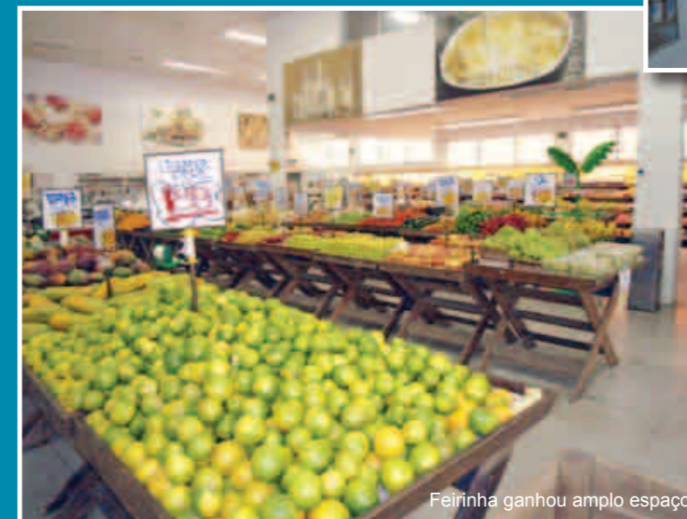
Feirinha ganhou amplo espaço

A loja 4 (Jd. São Vicente) está passando por um processo de revitalização, que começou em 22 de janeiro. A Feirinha ganhou um layout moderno - agora ocupa uma área maior, próxima à entrada da loja -, para facilitar o deslocamento dos associados durante as compras. Além disso, foram trocados os balcões da padaria, do açougue e do setor de frios.