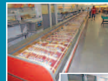
Novo balcão de carnes e frios

Mais novidades aguardam a loja 4. Está sendo criado um espaço para instalar um setor de utilidades domésticas e presentes (Bazar), parecido com o da loja 3. Aproveite e venha conferir as novidades da loja 4.